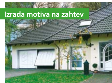
Izrada motiva na zahtev