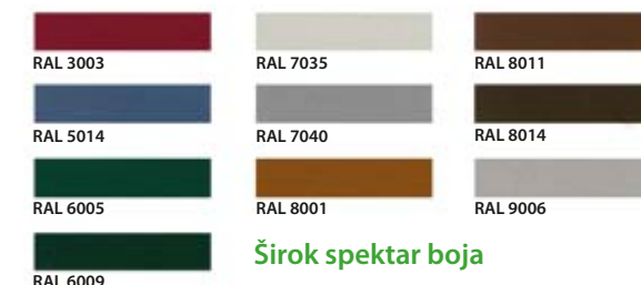
Širok spektar boja