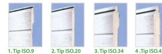
1. Tip ISO.9 2. Tip ISO.20 3. Tip ISO.34 4. Tip ISO.45