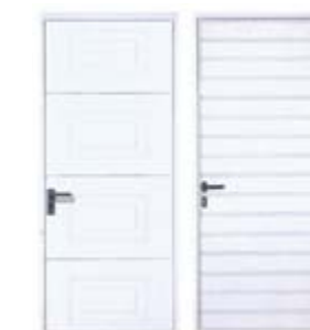
Vrata izrađena u motivu: horizontalni žljeb i kaset