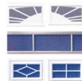
Različiti motivi zastakljenja